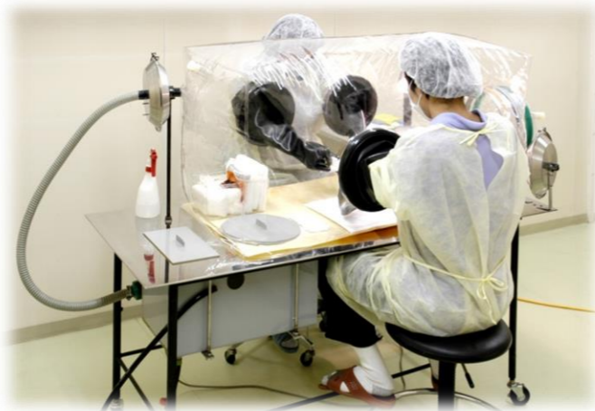
ビニールアイソレーターという装置を使用し、 マウスの微生物学的クリーニングを行います。