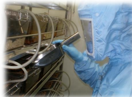
給餌作業を行っている所です。