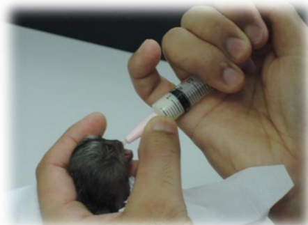
マーモセットの赤ちゃんには、 写真の様に人口哺育を行います。