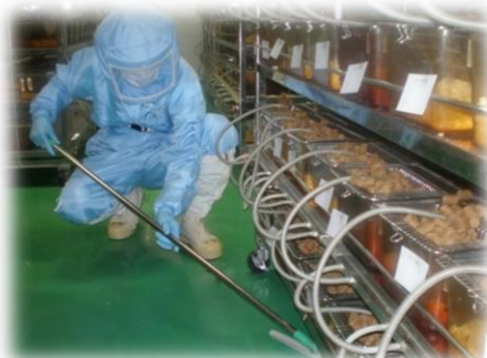
飼育室内は、毎日必ず清掃します。 清掃も重要な業務です！