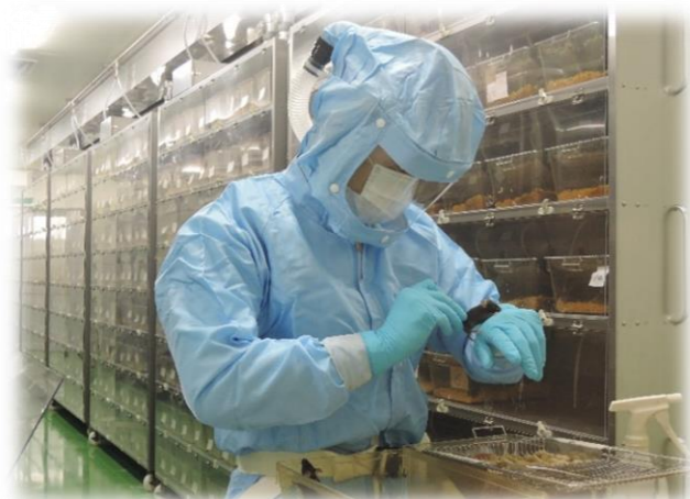
マウスの日常観察をしています！ 指の欠損がないか、尻尾の変形がないか等を確認します。